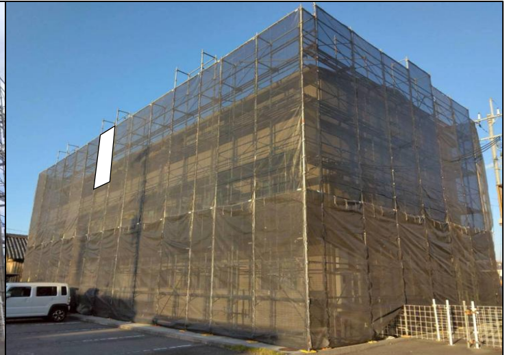
足場の組立が完了しました！ 安全確認・仕様確認！作業完了後点検をします！