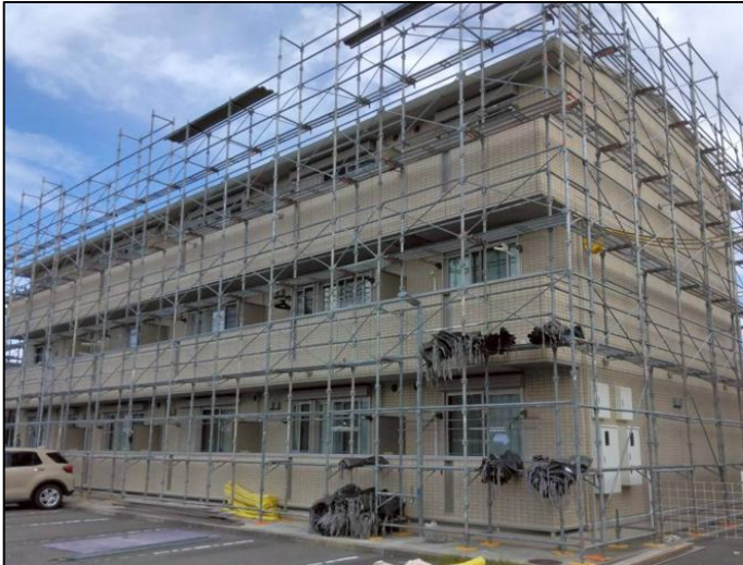
本体組立完了！ 養生材設置前の足場です

お世話になっているメーカー仕様610㎡、3階建て集合住宅の改修工事用足場の施工を行いました。 入居者の通行や車両の駐停車等があり、作業中の安全確認が欠かせない現場でした。 安全優先のためには「作業前点検・KYでの注意喚起」「事前打合せ」による作業区画の確認と営業 スタッフと施工スタッフの情報共有が必要となります。今回の現場では、作業前KYによる情報共有の 徹底により事故・トラブルなく工事を行い、お客様に満足いただける足場を施工できました。